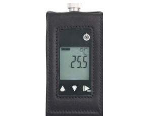
レーザー製保護ケース ST-G1000