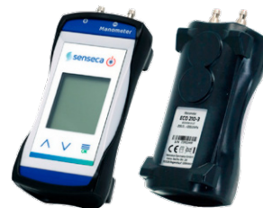
ゴム製保護カバー G1000-Cover