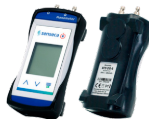
ゴム製保護カバー G1000-Cover