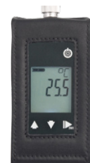
レーザー製保護ケース ST-G1000